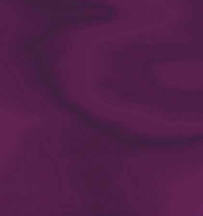
Figure 1. The relationship between the number of employees and the number of workstations and the number of employees per workstation.

workstations. The number of workstations is a function of the number of employees and the number of employees per workstation.