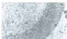
Рис. 2. Клетки энтероцита тонкого кишечника после курса БАД серии «Литовит» (состояние ворсинок нормализовано, исчезли нарушения в клетке; клетка и ее функции восстановлены). I этап гигиены ВСО — РОП соблюдается! Эффективность восприятия клеткой БАВ — 80-90 %

Для чего необходимо устранение интоксикации при заболеваниях кишечника?